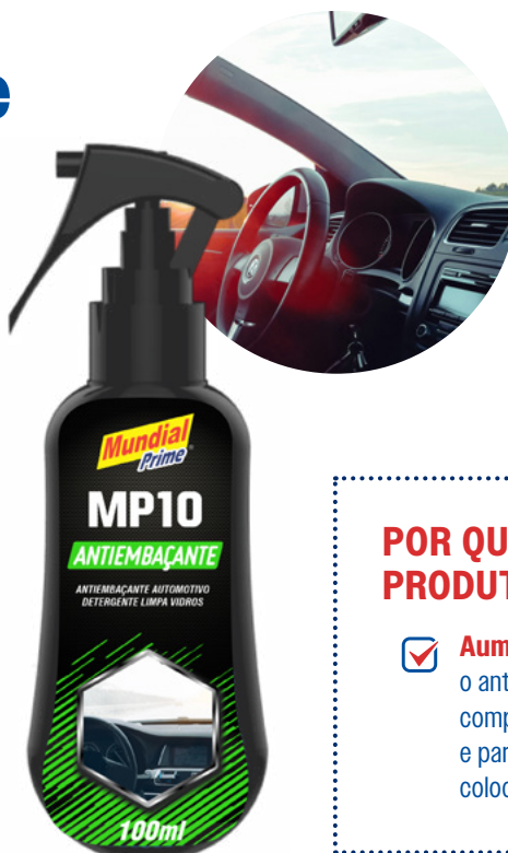
TABELA DE PRODUTOS

Pulverize internamente nos vidros do veículo. Após alguns segundos, limpe com pano ou lenço de papel.