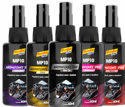
TABELA DE PRODUTOS

Agite bem o produto antes de usar. Posicione o atuador para o centro do carro. Pressione duas ou três vezes. Precisando, repita a operação.