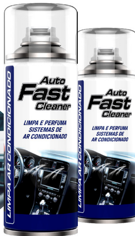
TABELA DE PRODUTOS