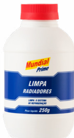
TABELA DE PRODUTOS

Limpa rapidamente e elimina a ferrugem e outros resíduos do sistema de arrefecimento, evitando o entupimento das pequenas passagens do radiador.