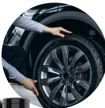
TABELA DE PRODUTOS