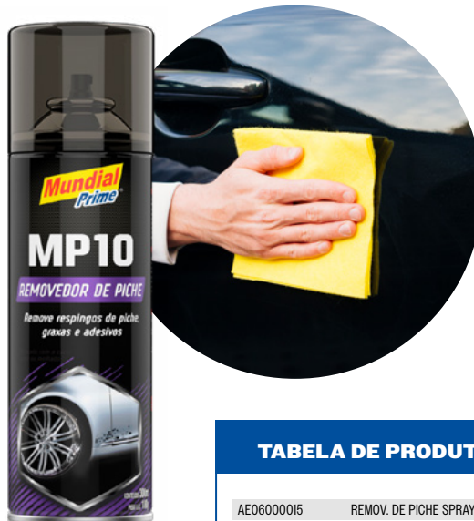
TABELA DE PRODUTOS

Ter um produto como esse te auxilia no seu posicionamento como loja, apoiado com o endosso da marca Mundial Prime.