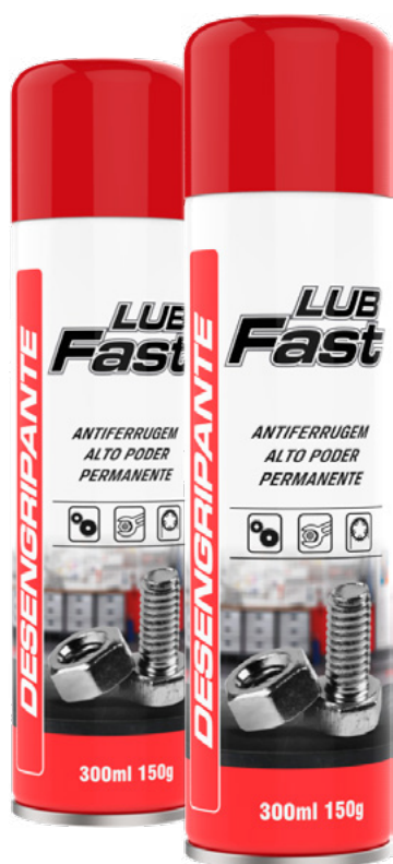
TABELA DE PRODUTOS