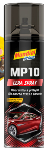
TABELA DE PRODUTOS